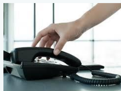
Evolução da Taxa de Penetração do Serviço Telefónico Fixo

O país com maior taxa de penetração do STF, em 2021, foi Portugal com um valor perto dos 51,7 por cento, seguido do Brasil com uma taxa de cerca de 13,5 por cento.