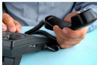
Evolução da Taxa de Penetração do Serviço Telefónico Fixo

O país com maior taxa de penetração do STF, em 2020, foi Portugal com um valor perto dos 50,6 por cento, seguido do Brasil com uma taxa de cerca de 14,5 por cento.