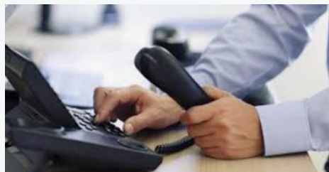
Evolução da Taxa de Penetração do Serviço Telefónico Fixo

O país com maior taxa de penetração do STF foi Portugal com um valor perto dos 49,4%, seguido do Brasil com uma taxa de cerca de 15,9% e de Cabo Verde com uma taxa de 10,7%. Os restantes países apresentaram valores abaixo dos 3%.