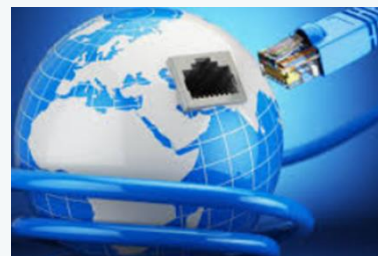
Evolução da Taxa de Penetração do Serviço de Banda Larga Fixa

O país com maior taxa de penetração na BLF, em 2019, foi Portugal com um valor perto dos 38,5 por cento, seguido do Brasil com uma taxa de cerca de 15,5 por cento e de Cabo Verde com 3,2 por cento. Os restantes países da CPLP apresentaram valores abaixo dos 3 por cento.